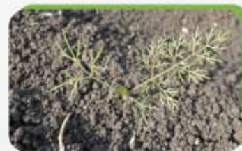
Aneth des moissons