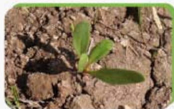
Renouée des oiseaux