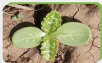
Chardon de Marie