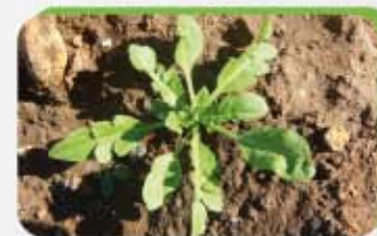
Bourse de pasteur